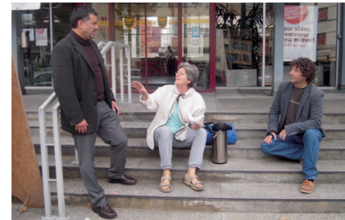
Les assistants sociaux du Graap-F ont activement participé à la Journée des proches aidants.

participé à la Journée des proches aidants. Ils étaient présents dans les gares avec des professionnels d'autres institutions et des proches pour sensibiliser le public à l'importance du rôle du proche et faire connaître les organisations actives dans ce domaine. Il est en effet important que les proches sachent où trouver information et appui en fonction de leurs besoins.